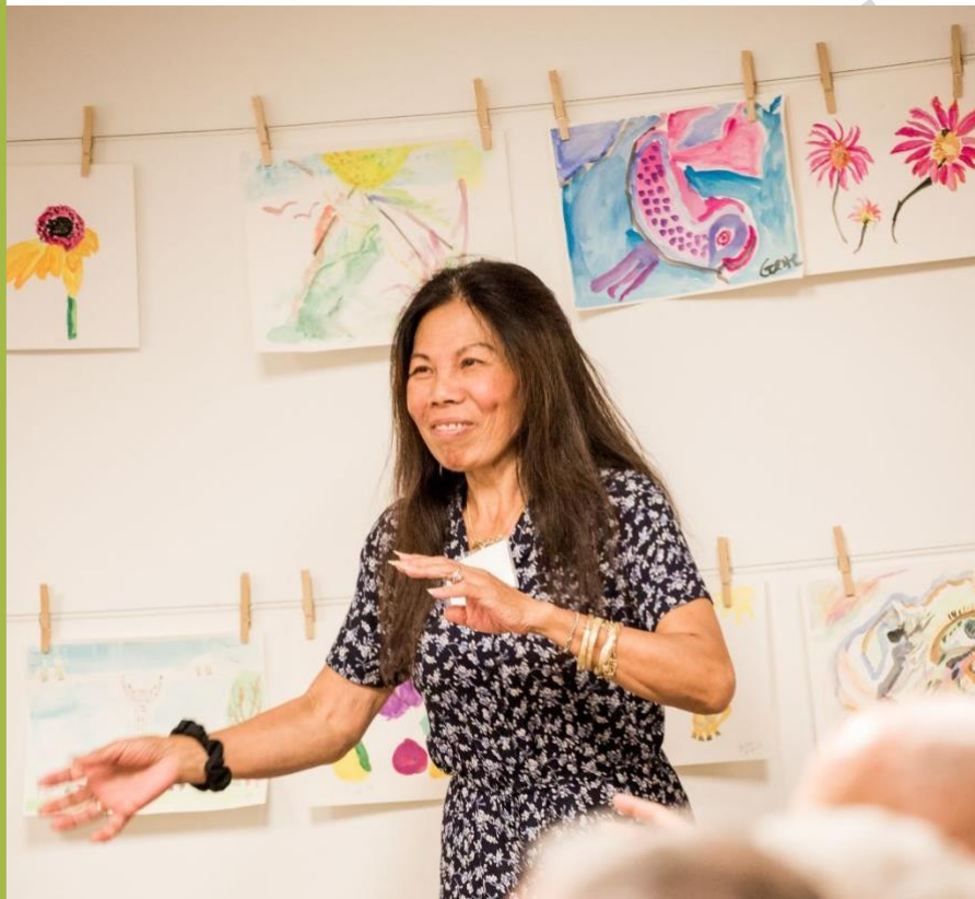
Đi lại và vận động.

Sống năng động sẽ giúp người mắc bệnh Alzheimer và người có liên quan đến chứng suy giảm trí nhớ cảm thấy dễ chịu hơn. Tập thể dục giúp duy trì cơ, khớp và tim của họ ở trạng thái tốt. Quý vị có thể tập thể dục chung để khiến việc tập thể dục trở nên vui vẻ và thú vị hơn.