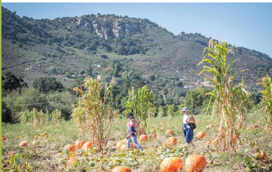
Đi chơi để kết nối.

Tham gia xã hội là một thành phần quan trọng trong việc duy trì tốt chất lượng cuộc sống. Những người ở giai đoạn đầu của bệnh Alzheimer (mất trí nhớ) hoặc có liên quan tới chứng suy giảm trí nhớ có thể vẫn thích đi chơi những nơi họ yêu thích trước đây như công viên, nhà hàng, bảo tàng ưa thích hoặc chỉ để gia đình và bạn bè đến thăm họ.