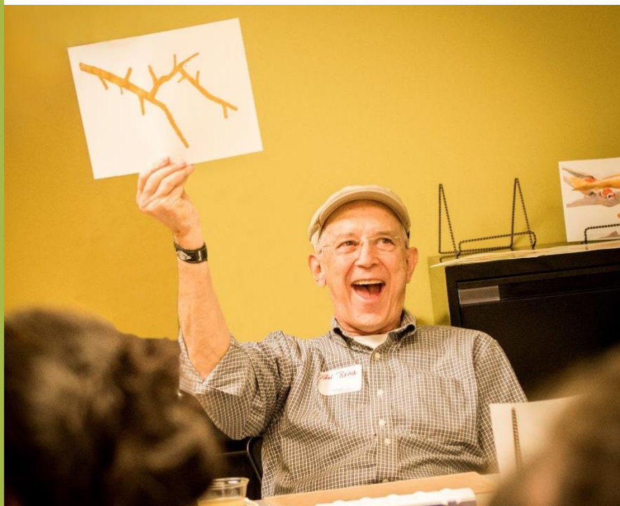
Ảnh của Alzheimer's San Diego: Ký ức nằm trong quá trình thực hiện.

Sáng tạo nghệ thuật có thể tạo ra cảm giác hoàn thành và có mục đích. Sáng tạo nghệ thuật cũng có thể tạo cơ hội cho người mắc chứng suy giảm trí nhớ và người chăm sóc thể hiện bản thân.