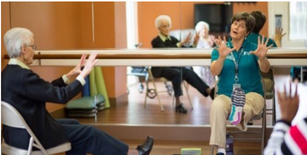
Ảnh của Nhà Cung Cấp Dịch Vụ Hỗ Trợ Người Cao Tuổi St. Paul